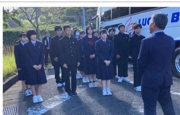
【3日目】 高畑PAでの 解団式