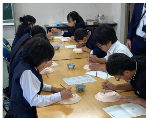
【3日目】 波佐見焼 絵付け体験