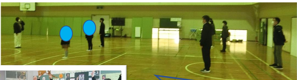
3/15 (水) 体育館で朝の会です。この後、全員で体を楽しく動かしました！