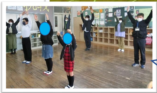
3/16 (木) 朝の活動「ラジオ体操」カメラ目線のお二人・・・、なかなかです