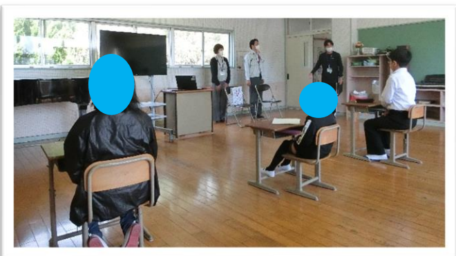
かんげい 「歓迎の言葉」です。

10月18日（火）に、長崎県食品安全消費生活課の方々をお招きして、「食品安全教室」を開催しました。一人一人の「健康」を維持するために、説明を聞いたり、クイズに答えたり、質問をしたりしながら食品の安全性について学びました。