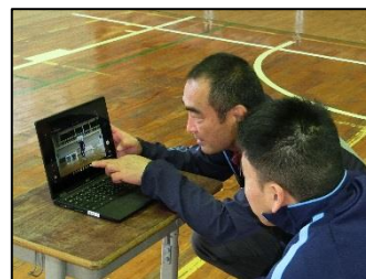
中学校保健体育科で、自身の投球フォームを確認しています。

他にも、動画を視聴して学習内容をさらに詳しく理解する、自分の考えを入力したメモを画面上で整理する、学習内容をまとめ保存する、さらにはプレゼンテーションソフトを用いて発表活動をする、など様々な活動を行っています。先日の中学校英語科の授業では、関係代名詞を用いた英文でクイズを作成し、それを教員にメールで出題するという活動も行われました。