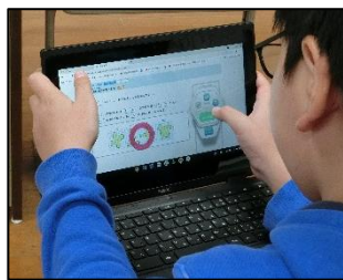
小学校算数科で、演習問題に取り組んでいます。