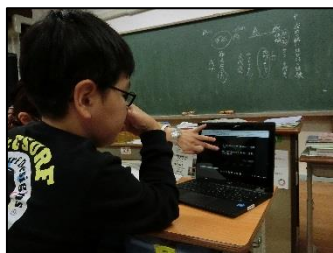
小学校国語科で、「座右の銘」について調べています。

本校では、以前からパソコンを活用した授業作りを実践していますが、タブレットPCをいかに効果的に活用するかを研究しているところです。