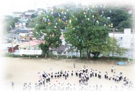
ピースバルーンリリース