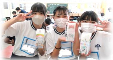
溶かしたろうを牛乳パックに入れて冷やして固め平和のメッセージを記入してできたキャンドル

午後は、平和祈念集会、ピースバルーンリリース、キャンドル点灯を行いました。平和祈念集会では、キッズゲルニカの代表の方や、ウクライナからの留学生やウクライナ現地から VTR で参加された先生などからメッセージをいただき、平和の大切さについて考える時間となりました。