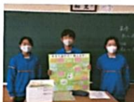
2年4組のみなさん！ ありがとうございました！