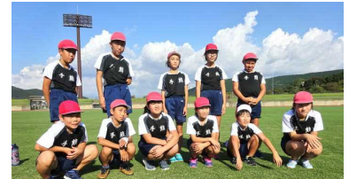
《陸上競技場での練習:10/4》

いよいよ明日が「小体会」です。5・6年生が小体会に向けて走り込んできた運動場には、たくさんの足跡が刻み込まれています。運動場は、君たちの練習する姿をずっと見つめてきました。運動場は、より速く走り、より高く遠くへジャンプしようと頑張ってきた君たちを応援しています。練習はうそをつかない。努力は、むく