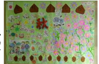
《10月玄関掲示:出口病院》

《手熊っ子、頑張れ!》 われる。手熊っ子よ、これまで頑張ってきた自分を信じ、最後まであきらめな! 小体会ではベストを尽くして頑張れ!