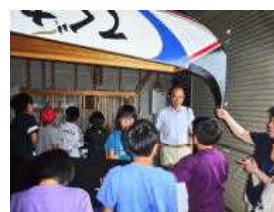
《ペーロン船の観察》

5・6年生は、先週26日(水曜)に手熊町公民館とペーロン格納庫で、手熊町自治会長の〇〇さんから「モットモ」と「ペーロン」について調べ学習をしました。更にたくさんの「問い」がでてきました。ふるさとの伝統行事について、深い学びができました。〇〇さん、御世話になりました。