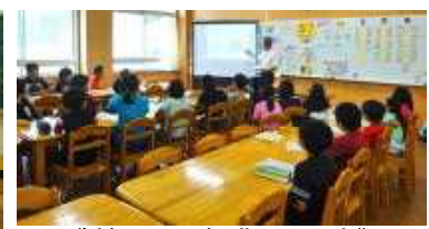
《情報モラル授業:3~6年》