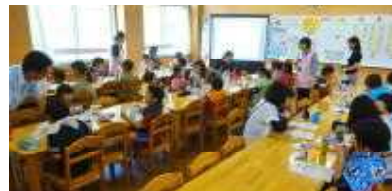
《ブラッシング指導:3~6年》

土曜授業(22日)の2・3校時は、歯科衛生士の〇〇さんと〇〇さんによる「ブラッシング指導」があり、歯を赤く染めプラーク(歯こう:細菌の塊)をしっかりと取り除くブラッシングの仕方を学びました。