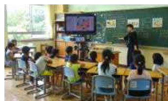
《情報モラル授業:1・2年》

そして、4校時は、校長(3～6年生)・教頭(1・2年生)が県教育委員会の「SNSノートながさき」を活用して「情報モラルの授業」をしました。子どもたちの意欲的な発言や態度に感心しました。またこの間に「学級懇談会」があり、学級担任と保護者、保護者同士で活発な意見交換があり、信頼関係を更に深めることができました。