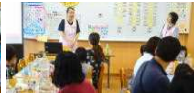
《ブラッシング指導:1・2年》

また、2・3校時の「道徳(生命尊重)の授業」では、一人一人が進んで自分の考えを発表し、命の大切さについてじっくりと考える機会となりました。これからも「心の教育」の充実を進めていきます。