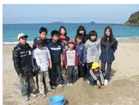
海水浴場の山づくり

弁天山では予め示されたクイズの答えを見つけること、海水浴場では決められた高さの砂山を作ること、そして農村公園では班で決めた遊びを行うことが条件でした。