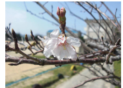
開花した学校の桜