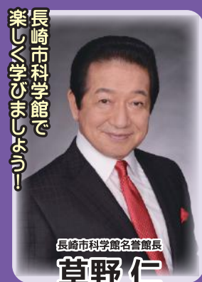
長崎市科学館で 楽しむ学びの時間

主催 / 長崎市教育委員会、NCC長崎文化放送、長崎市科学館(指定管理者:長崎ダイヤモンドスタッフ株式会社) 後援 / 長崎県、長崎県教育委員会、長崎市私立幼稚園協会、一般社団法人長崎市保育会、 長崎市学童保育連絡協議会、長崎新聞社、朝日新聞社、(株)長崎ケーブルメディア、ながさきプレス