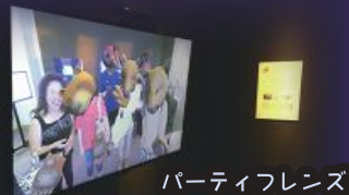
パーティフレンズ